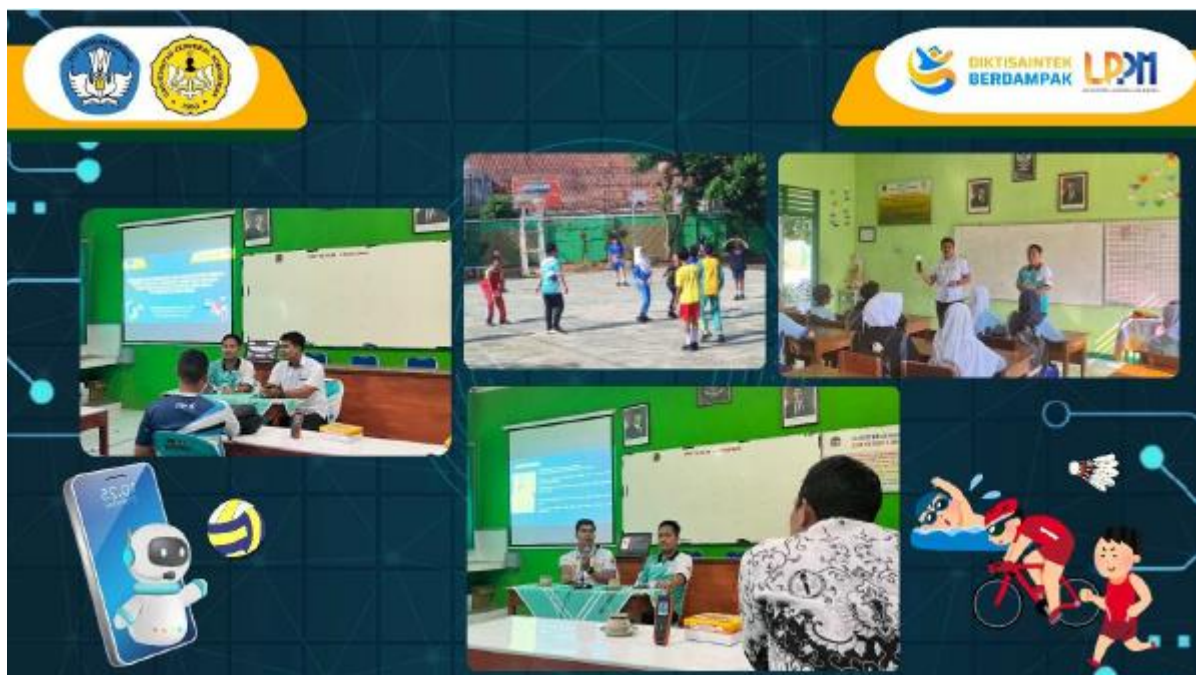
Gambar 1. Rangkaian Kegiatan