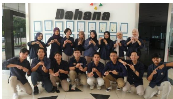
Gambar 1. Tim Magang Semua Divisi Periode Oktober

Salah satu program yang menonjol adalah Magang Generasi Bertalenta (MAGENTA) BUMN, yang dirancang untuk mengintegrasikan dunia akademik dengan dunia kerja. Program MAGENTA mencakup empat skema utama, yaitu Magang Umum, Magang Santri, Kampus Merdeka @BUMN, dan Indonesia Global Talent Internship. Kegiatan magang masyarakat yang dilaksanakan di PT Dahana bertujuan untuk mengembangkan keterampilan (skills), memperluas wawasan praktis, serta membentuk sikap profesional mahasiswa dalam menghadapi dunia kerja nyata. Melalui program magang ini, mahasiswa memperoleh kesempatan untuk menerapkan ilmu yang telah dipelajari di bangku perkuliahan ke dalam praktik langsung di industri, khususnya dalam bidang bahan peledak komersial dan pertahanan.