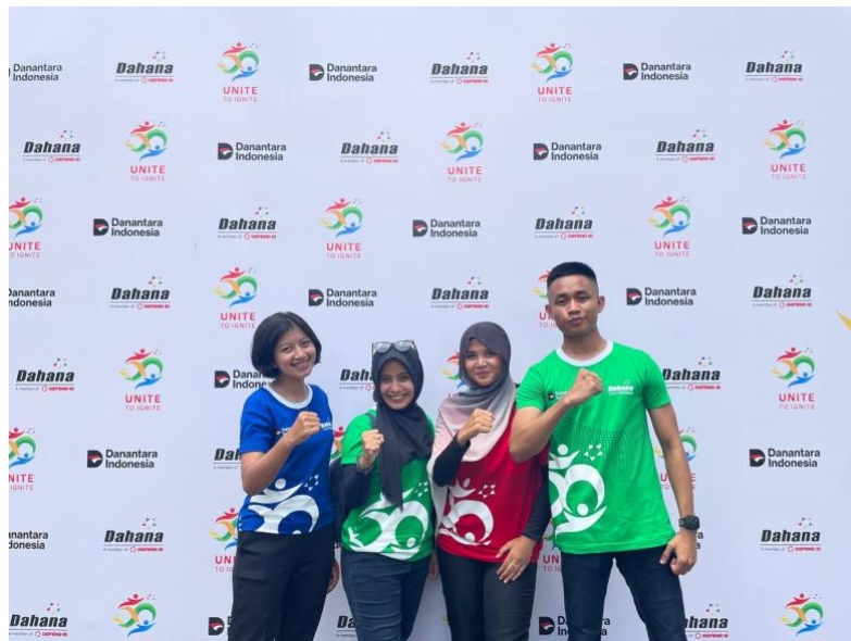
Gambar 2. Setelah Briefing dengan SM

Selain itu, mahasiswa turut berpartisipasi dalam proyek perusahaan yang sedang dikembangkan, baik dalam bentuk studi pendukung, pengumpulan data, maupun penyusunan dokumentasi teknis. Keterlibatan ini memberikan kesempatan bagi mahasiswa untuk memahami bagaimana inovasi dan riset terapan dijalankan dalam konteks industri pertahanan.