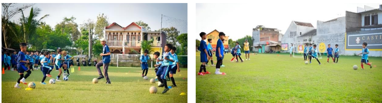
Gambar 1. Pemberian Latihan Ball Feeling di SSB Rabbani Putra Mandiri Malang

Merujuk pada Tabel 1 , diketahui bahwa ada peningkatan keterampilan menggiring bola antara awal dan akhir yang diketahui melalui peningkatan nilai Mean yaitu yang semula 51,35 meningkat menjadi 61,75. Untuk memastikan ada tidaknya peningkatan, maka dilakukan uji beda, namun sebelumnya perlu dilakukan uji prasyarat analisis yang meliputi uji normalitas dan uji homogenitas.