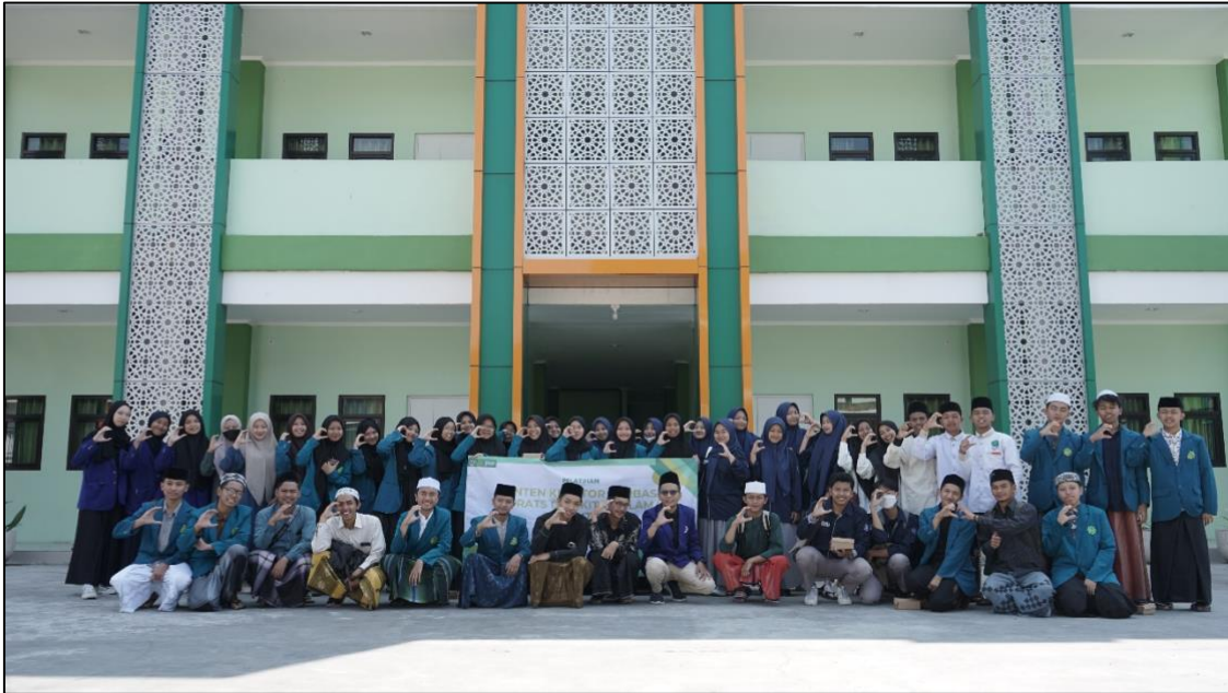
Gambar 6. Foto Bersama dengan para Santri Kota Batu Setelah Kegiatan Pengabdian Masyarakat “Dakwah Digital”

pembuatan konten dakwah. Pelatihan ini tidak hanya fokus pada aspek teknis seperti pengelolaan media sosial, tetapi juga pada penguatan pemahaman tentang nilai-nilai moderasi dan cara menyampaikannya secara efektif. Dengan demikian, para dai atau pelaku dakwah digital dapat menciptakan konten yang tidak hanya informatif, tetapi juga menginspirasi dan mendorong partisipasi aktif masyarakat dalam menyebarkan pesan-pesan moderasi. Melalui upaya ini, dakwah digital dapat menjadi alat yang sangat berguna dalam membangun masyarakat yang lebih toleran dan berwawasan luas.