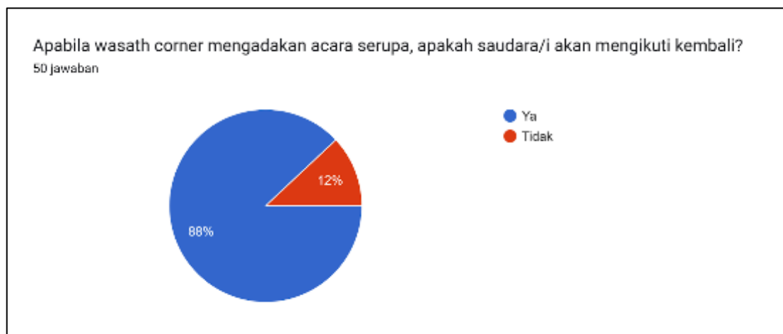
Gambar 5. Hasil jawaban keberlanjutan pelatihan

Menurut mereka pelaksanaan pelatihan konten kreator ini sangat membantu para santri untuk mengembangkan kemampuan dalam upaya menjadi konten kreator yang islami yang mampu menyebarkan dakwah moderasi beragama melalui media sosial. Sehingga konten yang berasal dari ilmu yang mereka pelajari di pondok pesantren, dimana yang bersumber dari turats atau kitab ulama nusantara bisa dinikmati oleh masyarakat luas. Mereka juga mengatakan bahwa pelaksanaan pelatihan konten kreator sangat mudah dipahami, seru dan menarik. Para peserta juga bersedia mengikuti pelatihan lanjutan apabila memang ada tindak lanjut dari program pengabdian ini. Menurut hasil kuesioner, 88% peserta menjawab akan mengikuti kegiatan pelatihan lagi, sedangkan 12% tidak (Gambar 5).